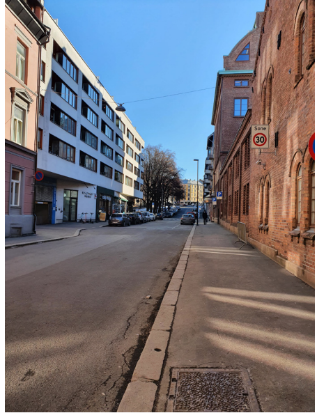
Dalbergstien i 2021 sett fra Pilestredet.

Ifølge Oslo Byleksikon ble det anlagt en løkke nr. 60 på Bymarken, midt på dagens Bislett. Denne løkken var tilknyttet Kongens gate 20 i Kvadraturen. En løkke var et jordbruksareal eid av byen og avsatt til å fø byens befolkning. Løkke nr. 60 var i 1697 på 37 mål. Rundt 1800 hadde den vokst til 74,5 mål. I dag er ingenting