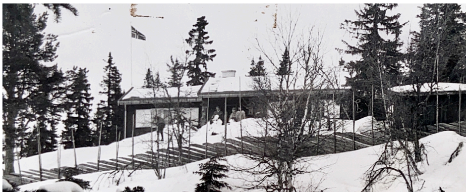
Hytta i Valdres.

Sosiologen Anton Antonovsky (1993) skriver at for å oppnå en følelse av sammenheng i livene våre, må vi kjenne på en tilhørighet i tid og sted. Bestefaren til min mann spurte nesten alltid om mine foreldre og familie i Australia.