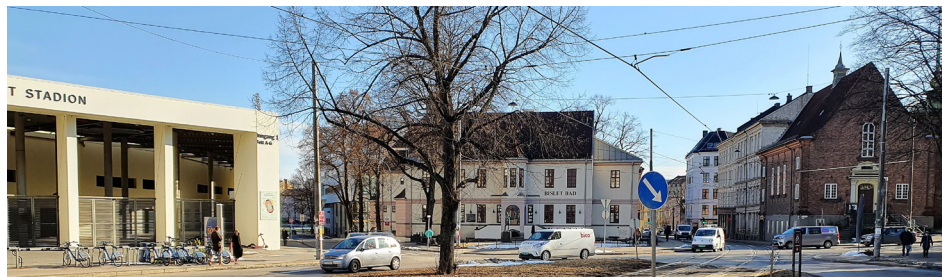
Slik ser Bislett ut i dag med Bislett stadion, Bislett bad og Vestre frikirke.

Offisielt er Oslos grunnleggelse tidfestet til år 1048. Men stadig nye funn, gjør at man tror det var en bymessig bebyggelse allerede rundt år 1000, kanskje enda tidligere. Det som var av bebyggelse, lå på østsiden av Bjørvika. Landområdene rundt var mark og skog. Selv da byen brant og Christian IV i 1624 etablerte den